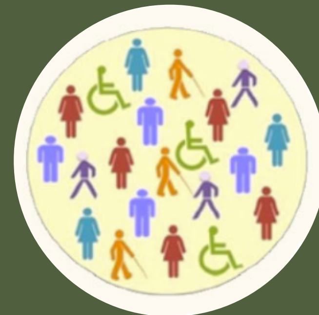
uključivanje = integracija s interakcijom

raznolikost = poticaj za učenje i uklanjanje predrasuda