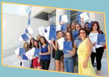
Svečana dodjela svjedodžbi o položenom završnom ispitu i Europass priloga svjedodžbi dentalnim asistenticama Zdravstvene škole u Splitu (lipanj 2015.)