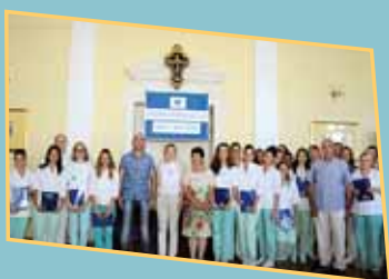
Svečana dodjela svjedodžbi o položenom završnom ispitu i Europass priloga svjedodžbi dentalnim asistenticama i asistentu Medicinske škole u Rijeci (srpanj 2015.)