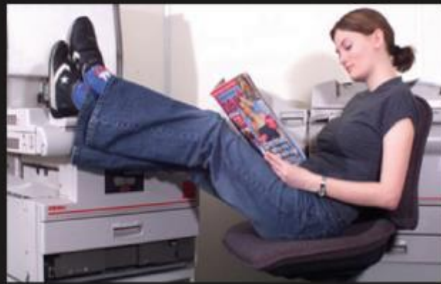
What the Commission thinks I do