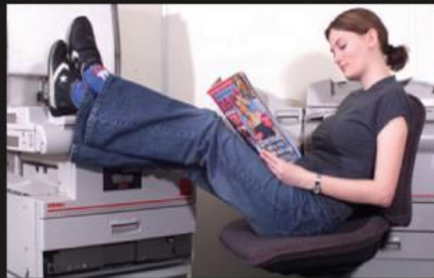
What the Commission thinks I do