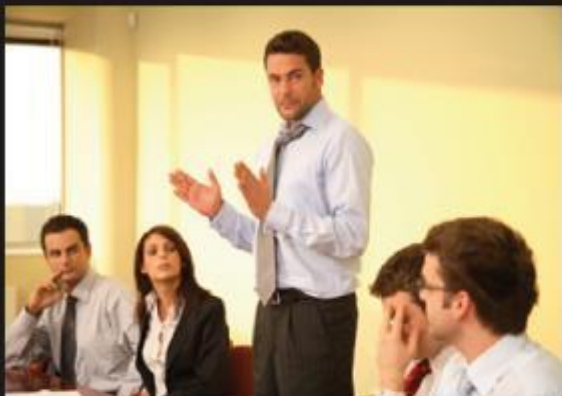
What my family thinks I do