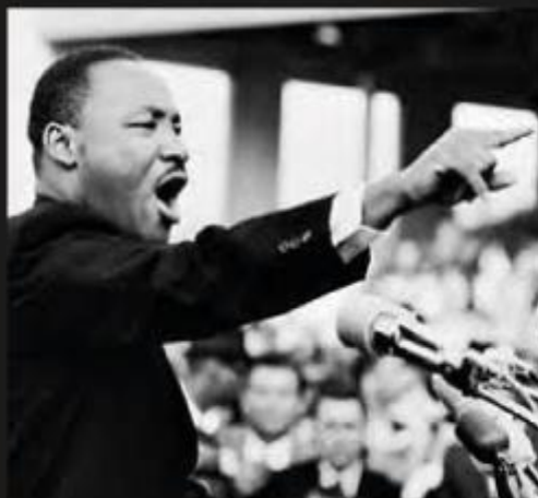
What I think I do