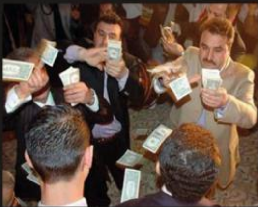
What the beneficiaries think I do