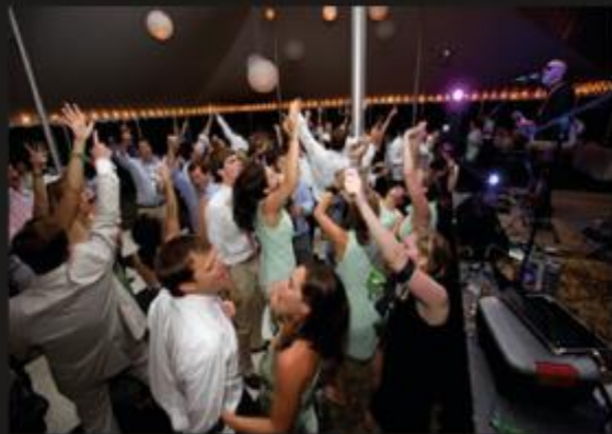
What my friends think I do